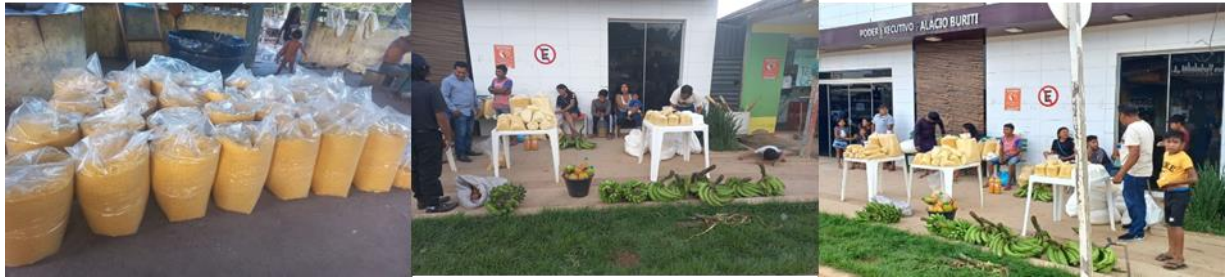
Figura 2 – Feira da Farinha Munduruku em Jacareacanga/PA.