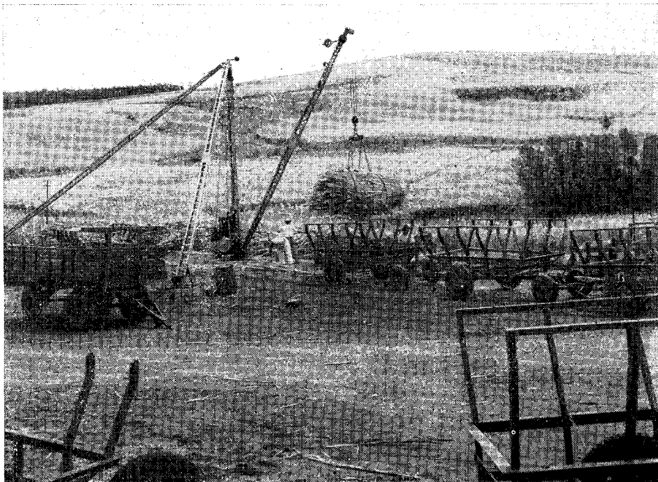
Município de Santa Rosa de Viterbo — São Paulo (Foto CNG n.º 5213-T.S.).

Na foto, um dos guindastes em pleno funcionamento, as carrêtas e, ao fundo, um dos canais da usina (Com. M.C.V.).