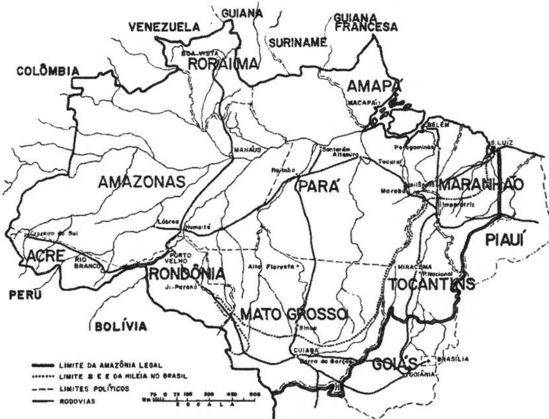
FIGURA 2 A AMAZÔNIA LEGAL E OS LIMITES DA HILÉIA NO BRASIL

Nem as "companhias colonizadoras" nem o INCRA foram capazes de fixar totalmente os migrantes. Muitos deles, quando puderam, abandonaram seus lotes e vieram para a periferia das cidades. Outros se internaram mais na selva, em busca de terras virgens.