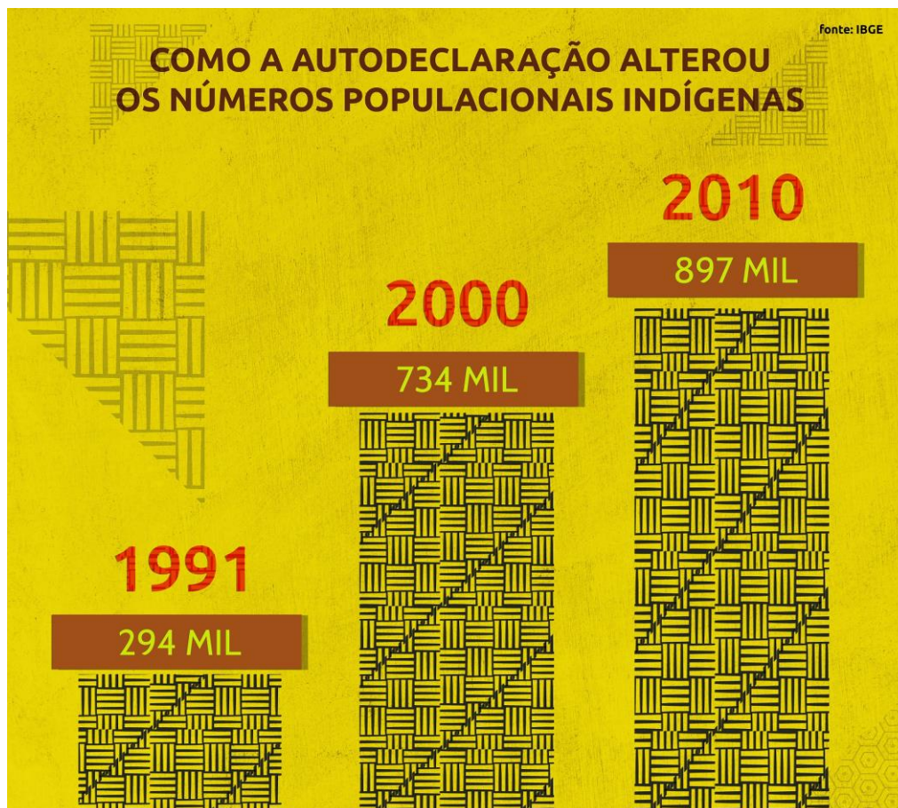
Figura 2. DATAM abril de 2019.

longo do tempo e seus impactos no dimensionamento populacional dos indígenas. Dar destaque para esse processo é importante porque esta categoria do IBGE é uma das mais utilizadas para pesquisas nos mais diversos campos